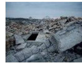
Снос СКВОТа 2013 год