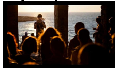
ФотоКиноФестиваль 19 августа 2012