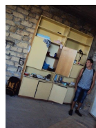
Сквотирование и обустройство социально культурного Центра