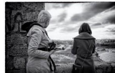
Осенний бал 25 ноября 2012